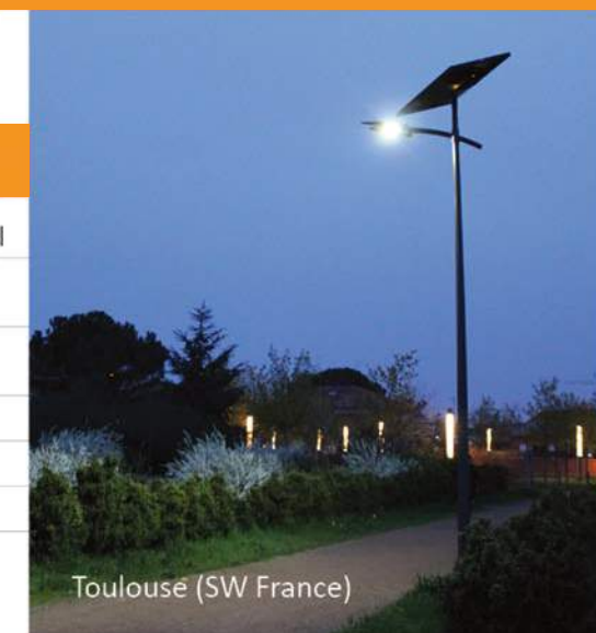
Toulouse (SW France)