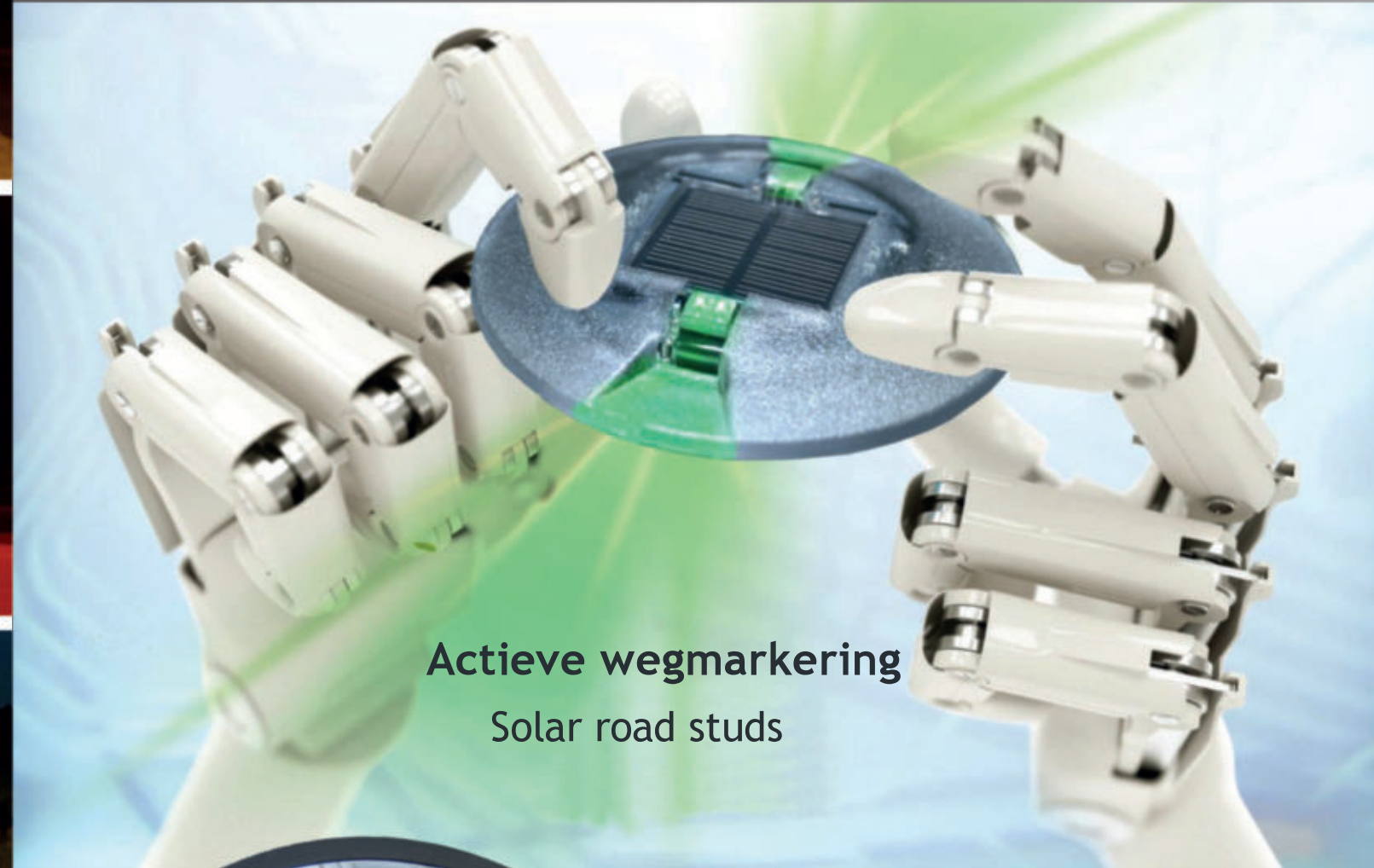
Actieve wegmarkering Solar road studs